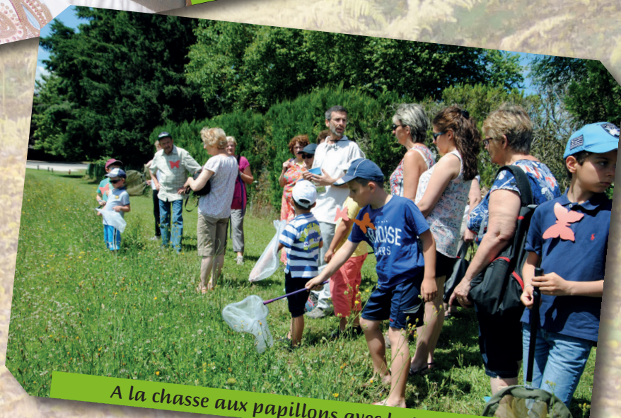
A la chasse aux papillons avec la Maison de la Forêt