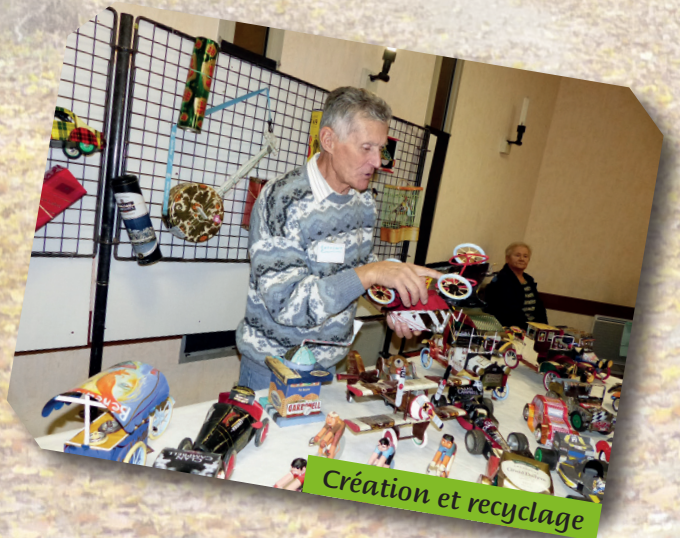
Création et recyclage