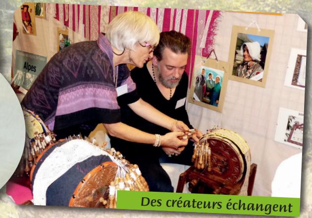
Des créateurs échangent