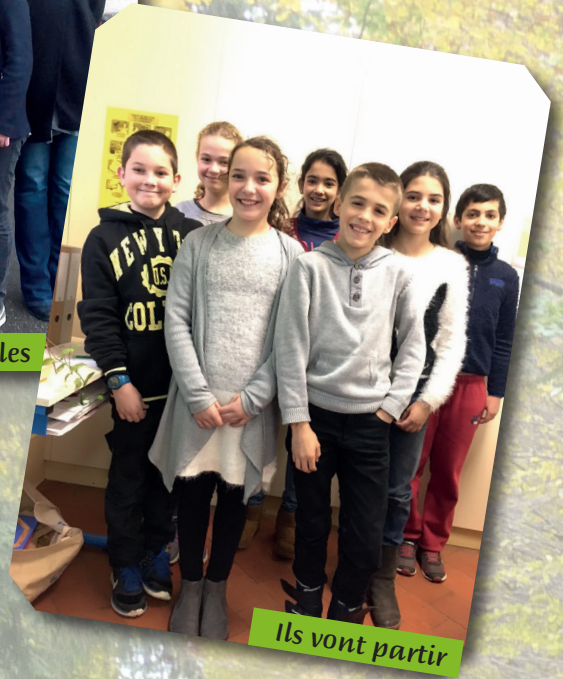
Ils vont partir