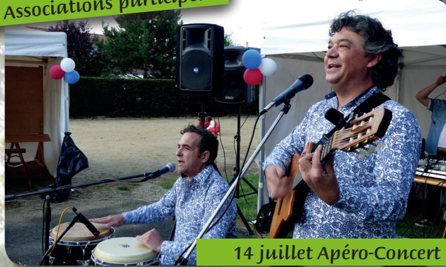
14 juillet Apéro-Concert