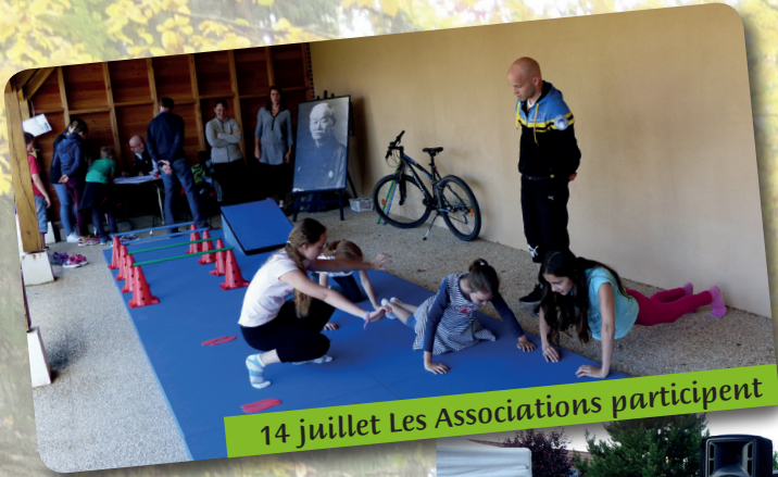
14 juillet Les Associations participent