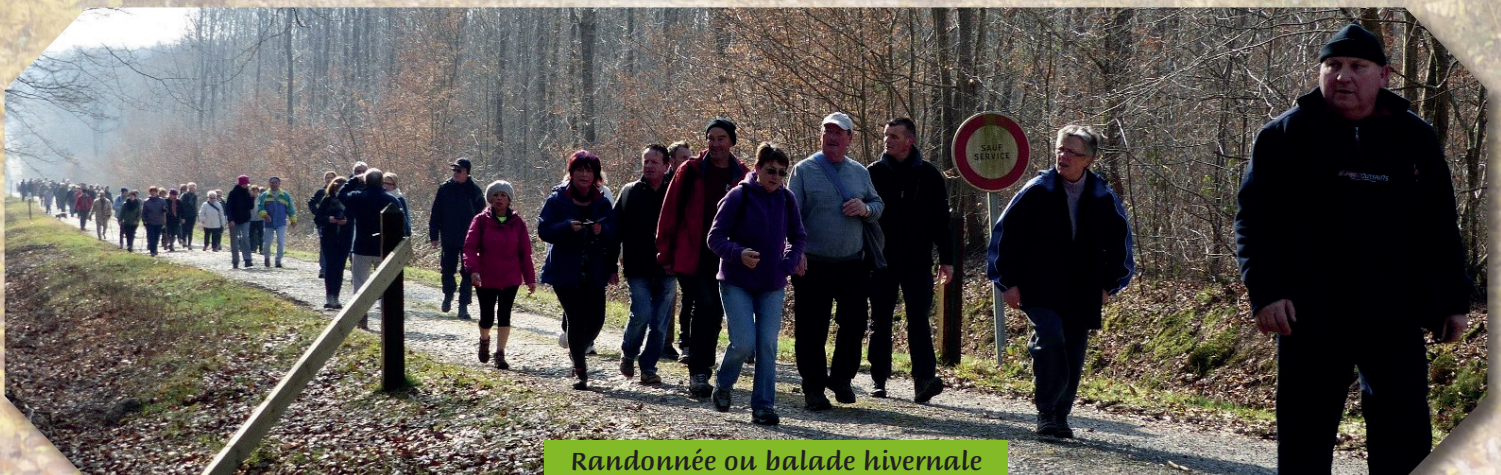
Randonnée ou balade hivernale