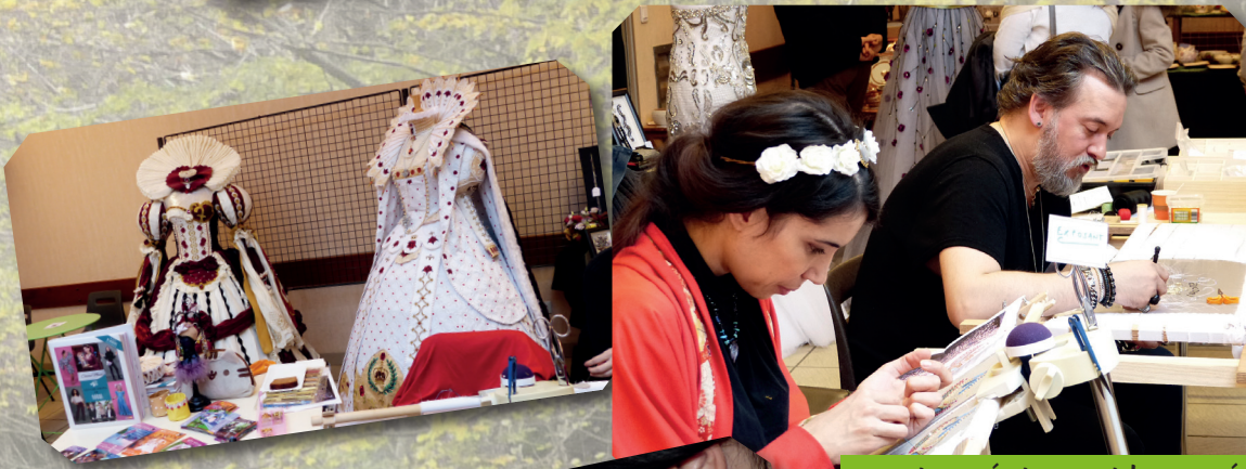
Les créateurs et leurs créations