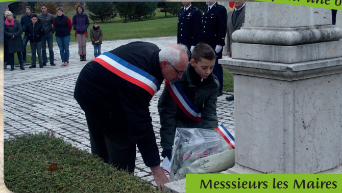
Messieurs les Maires