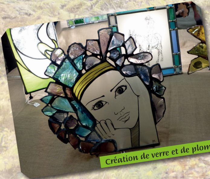
Création de verre et de plomb