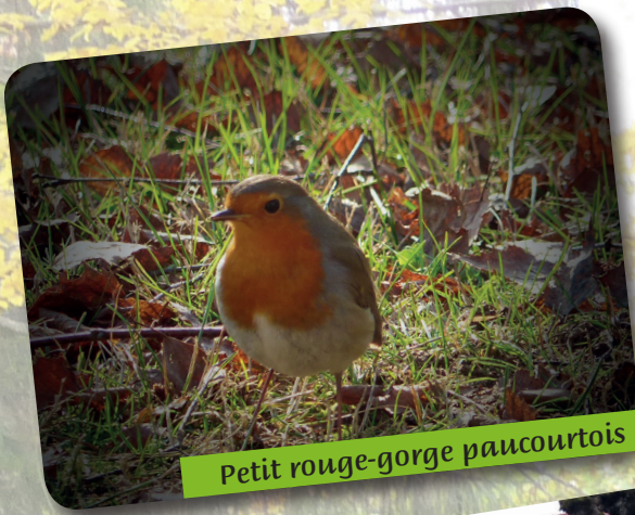
Petit rouge-gorge paucourtois