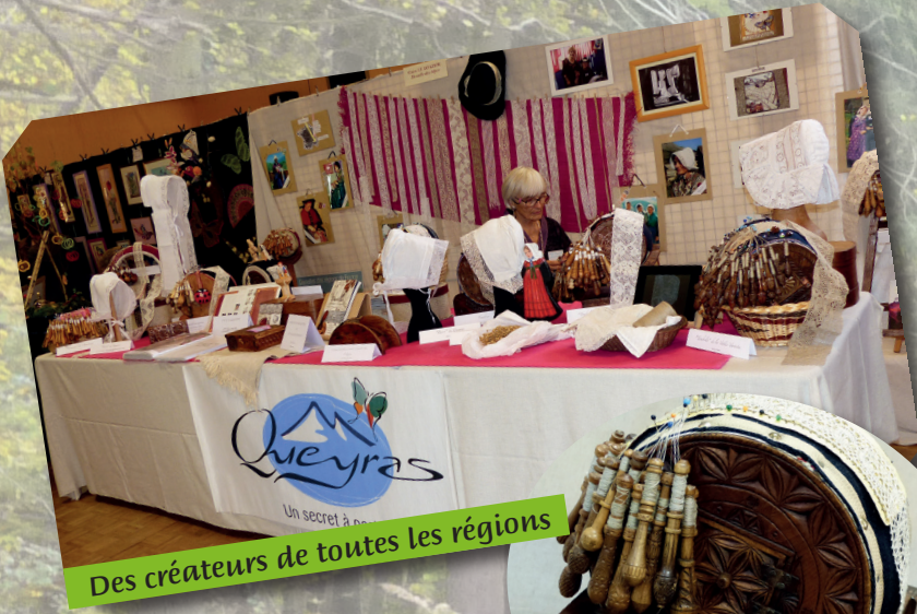
Des créateurs de toutes les régions