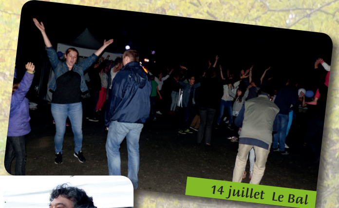
14 juillet Le Bal