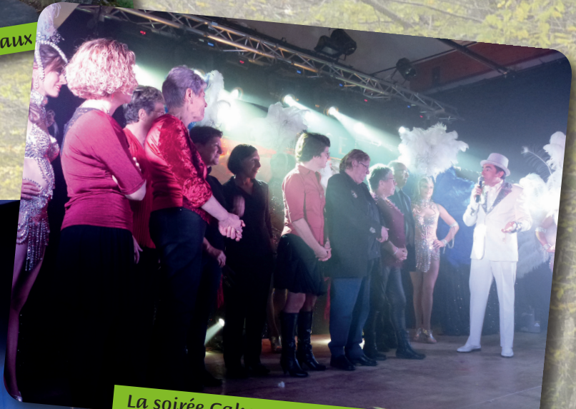
La soirée Cabaret : les bénévoles sur la scène