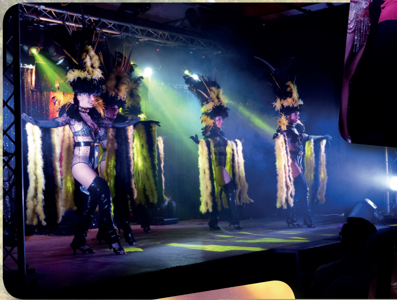
La soirée Cabaret avec Apothéose