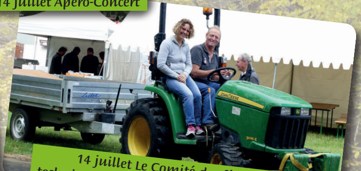
14 juillet Le Comité des fêtes et les services techniques pour une organisation impeccable !