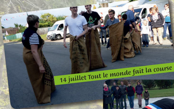
14 juillet Tout le monde fait la course