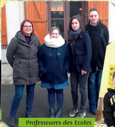
Professeures des Ecoles