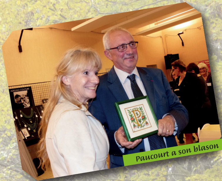
Paucourt a son blason