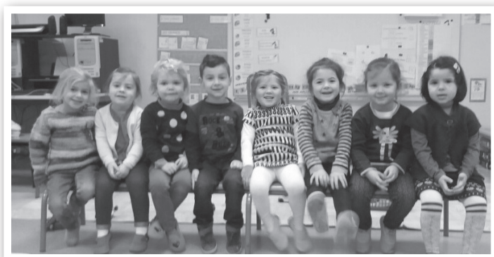
Ils sont arrivés

Des spécialistes interviennent avec un financement d'agglomération. Du rugby est prévu pour les CE et les CM. Et comme tous les ans, 3 cycles de natation à la piscine de Chalette/Loing pour respectivement les CP, les CE et les CM. Des ateliers cuisine sont prévus pour les CE/CM et les CP/maternelles.