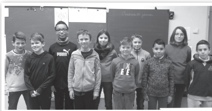
Ils vont partir

L'emploi du temps scolaire obligatoire prévu se déroule du lundi au vendredi de 8h30 à 11h30 et de 13h30 à 16h30.