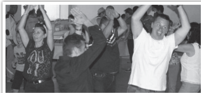
Les concerts attirent de 140 à 150 spectateurs, il peut être prudent de réserver.