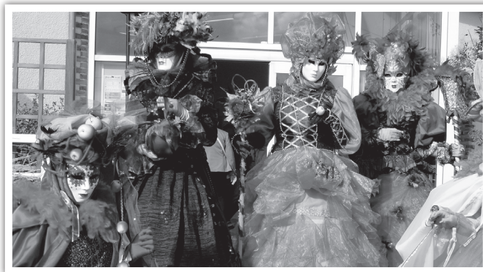
L'association des Vénitiens de Montargis avec leurs magnifiques costumes ont assuré le spectacle.

- La 7 ème Fête de la Pomme, le dimanche 22 Octobre , avec la participation des Croqueurs de Pomme du Bocage Gâtinais.