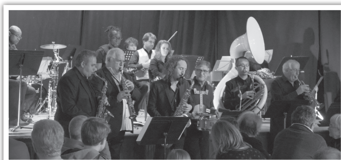
L'APAM, propose des soirées musicales de qualité, comme ce dernier concert jazz avec « A Night in Gâtinais » le 2 décembre 2017.